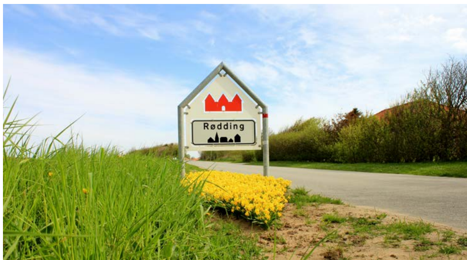
Rødding (og Spøttrup Borg)

Befolkningsudviklingen har som mange andre steder været præget af en tilbagegang, men fra lokalt hold fremhæves, at der samtidig er sket en vis tilflytning af børnefamilier. Den 1. januar 2015 boede ca. 1.480 personer i sognet, og mange sommerhusgæster færdes i nabolaget.