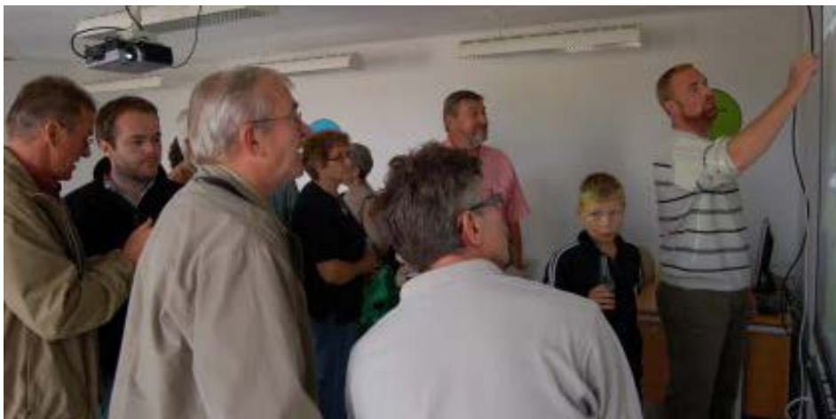
Der skal arbejdes ud fra en fælles strategi.

Ovenstående vil tilsammen næppe kunne lade sig gøre, med mindre ”organisering” (midterfeltet) er indrettet til at agere strategisk – at man kan ”aktivere det hele”.