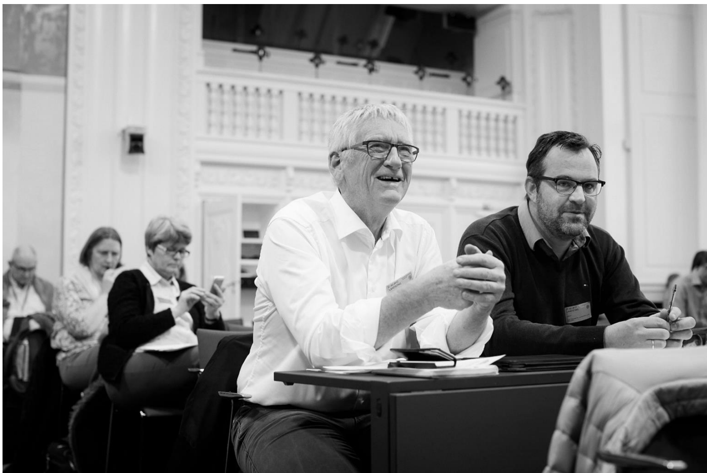
Folketingshøring om dansk landdistriktspolitik i nyere tid.