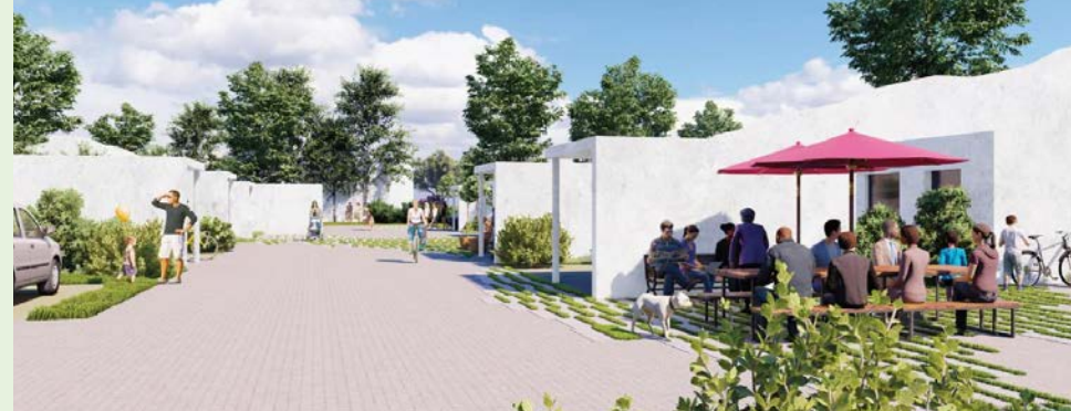
Ill.: Boligselskabet Sct. Jørgen

Derfor er det vigtigt at nævne, at bofællesskaber ikke kun er for seniorer. I stedet bør man se muligheder i at etablere fællesskaber, der er fleksible - både i forhold til beboersammensætning og i forhold til bebyggelsens og boligernes fleksibilitet, så de kan tilpasse sig ændrede behov over tid. En ny boligbebyggelse, Skalmaparken, i Skals er et godt eksempel til inspiration for andre landsbyer.