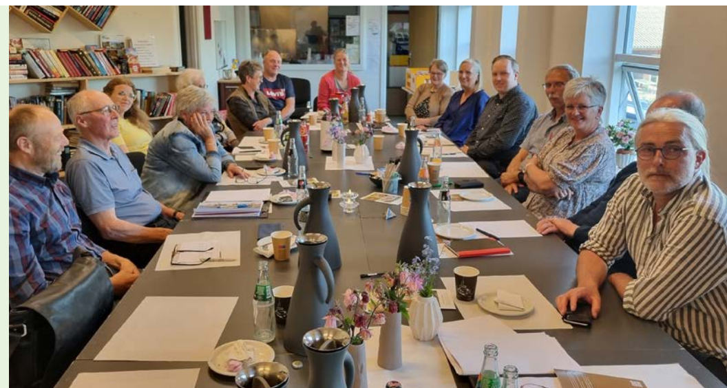
Fra dialogmødet i Givskud Hallens lokaler