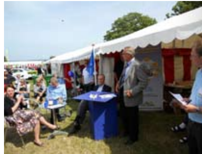
Fra det 1. debatmøde uden for vores telt. Her ses de fire indledere, samt formanden.