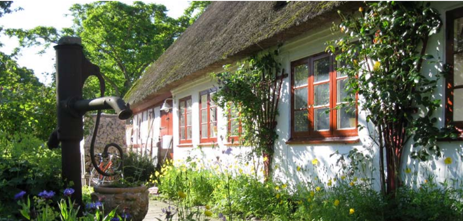
Desværre kan Danmarks landsbyer ikke leve af idyl alene.