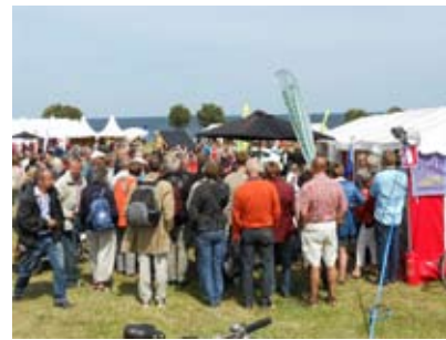
Der var stor tilslutning til vore debatter.