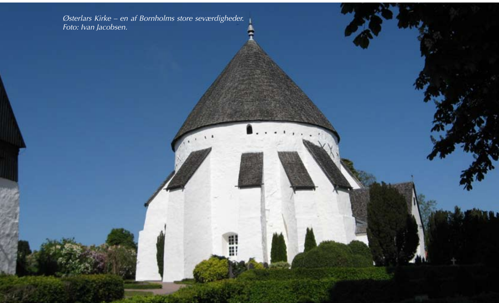
Østerlars Kirke – en af Bornholms store seværdigheder.

Resten af artiklen kan læses på Danske Landsbyer hjemmeside: http://landdistrikterne.dk/danskelandsbyer/