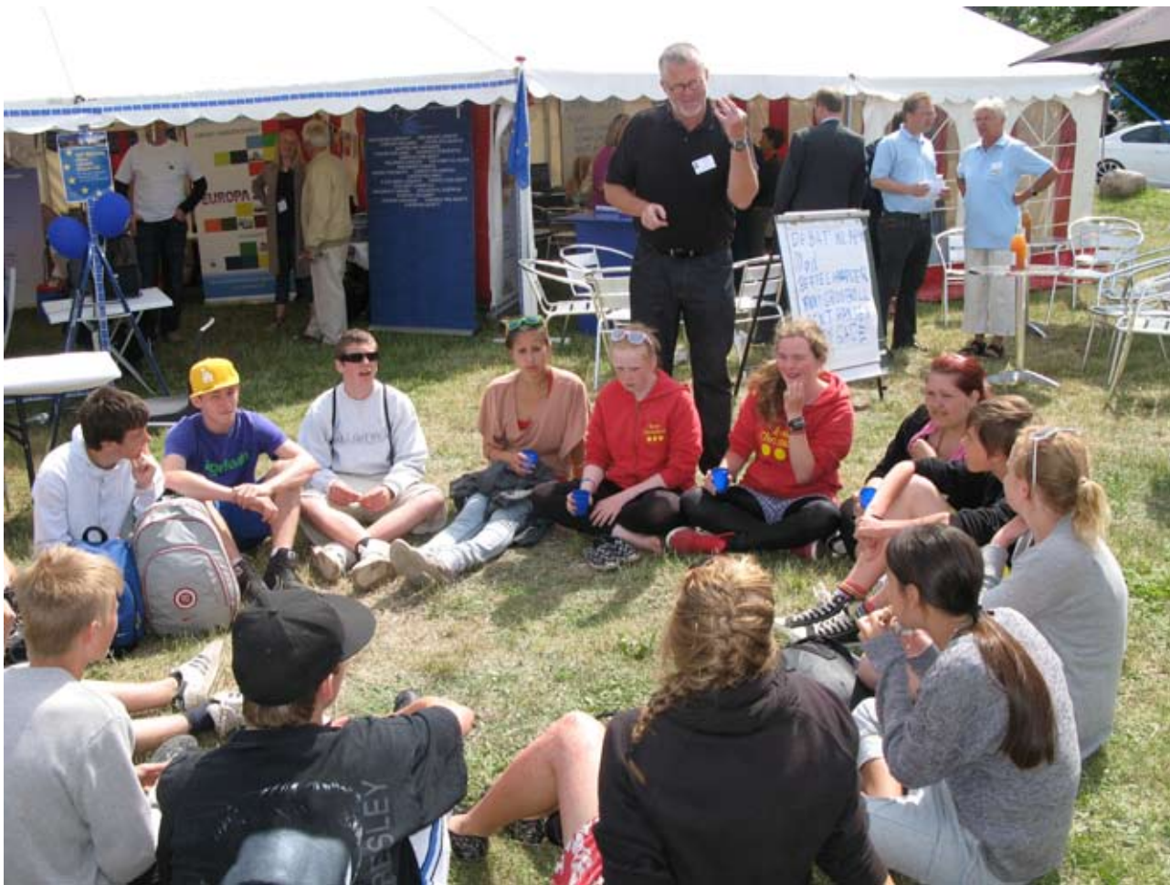
Der var stor tilslutning til vore arrangementer. Her ses en gruppe unge ivrigt optaget af at diskutere demokrati.