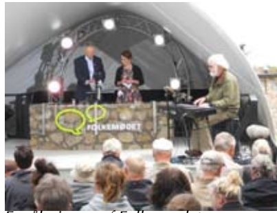
Fra åbningen af Folkemødet.